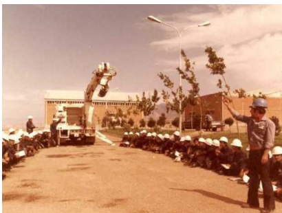
پردیس فنی و مهندسی شهید عباسپور در دهه ۱۳۵۰