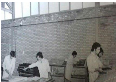
چاپخانه دانشگاه شهید بهشتی در دهه ۱۳۴۰ شمسی